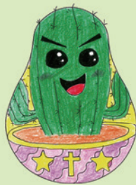
初級組季軍 2C 林幸晴