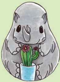
初級組亞軍 2B 卞之琳