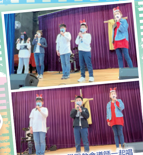
高年級的同學跟教會導師一起唱《誰曾應許》，十分動聽！