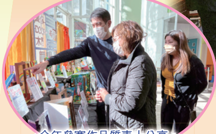
今年參賽作品質素十分高，評選作品時，令評判傷透腦筋。