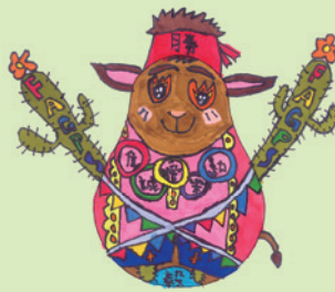
高級組冠軍 5B 謝卓庭