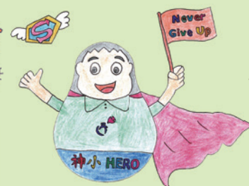
高級組亞軍 6B 陳宏鎧