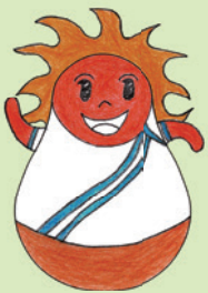
初級組冠軍 3A 鍾宇翔

本年度本校的訓育主題是培育學生堅毅盡責的良好品德，為了建立積極正面的校園文化和以具體鮮明形式呈現堅毅的精神，本校訓輔組和視藝科於去年9月合辦「不倒翁」吉祥物親子設計比賽。藉着「不倒翁」怎麼樣也推不倒的特性，鼓勵同學們要有堅毅不拔、永不放棄的精神。