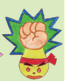
高級組季軍 4D 陳珈喬