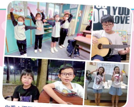
你看！不同年級的同學都施展渾身解數，用他們喜歡的方式演繹詩歌，可見同學非常多才多藝。