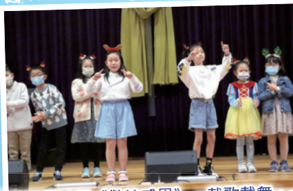
低年級的同學演繹《歡笑感恩》，載歌載舞，一點也不怯場！