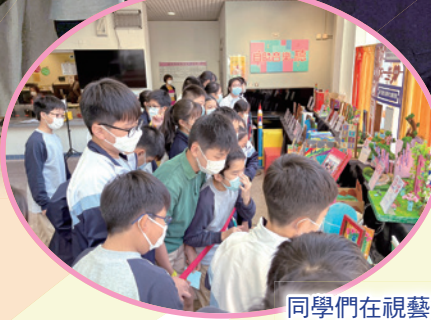
同學們在視藝課進行投票活動。