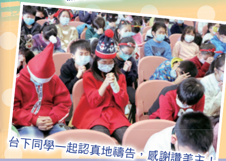
台下同學一起認真地禱告，感謝讚美主！