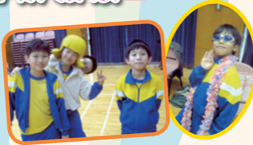
學生能運用道具進行即興創作，動作維妙維肖！

本校中文科及戲劇科的老師於本年度二月七日到九龍慈雲山藍色園主辦可立小學進行戲劇科交流活動，而該校的戲劇老師於三月二十六日亦到訪本校進行戲劇觀課活動。兩校彼此互相觀摩，並藉著研討會進行戲劇科的教學交流，雙方獲益良多！