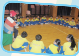
老師以「教師入戲」的方式與學生對話，以提昇學生的反思及判斷能力。