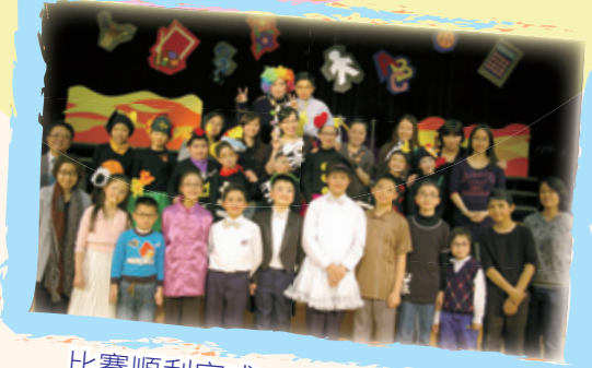
比賽順利完成，一起拍照留念！