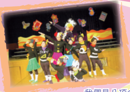
我們是八項多元智能精靈！

最終龍仔能否一展所長？龍爸與龍仔會否和好如初？精靈們又可否順利升級？就讓我們一起揭開旅程的序幕！