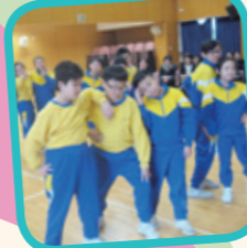
學生的定格姿態多吸引