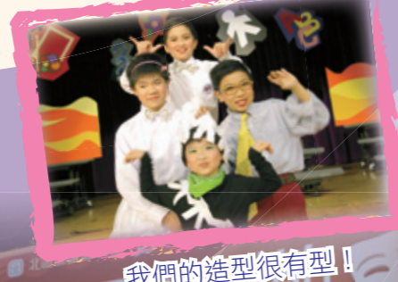
我們的造型很有型！