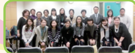
兩校老師彼此進行戲劇教學交流，提昇教學質素。